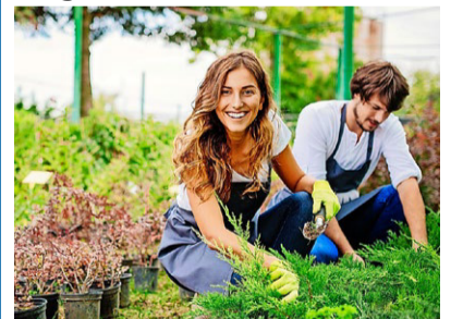
Wie im Garten Unfälle vermieden werden können.