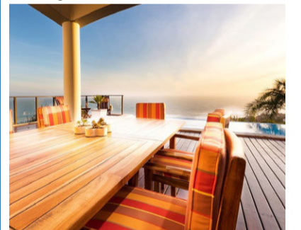
Das «classicalView»-Gästehaus besticht durch Komfort.