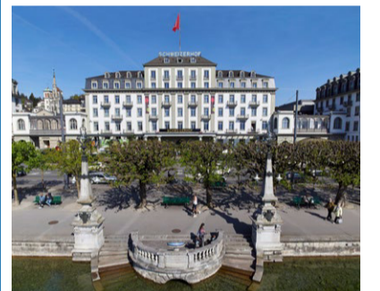
Das Hotel Schweizerhof Luzern lanciert neues Festival.