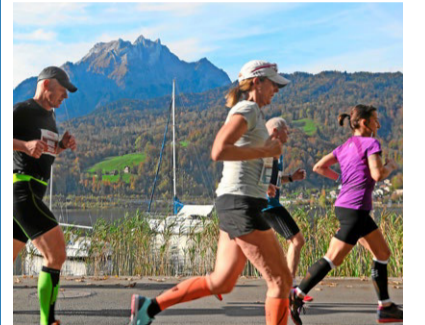
Horw unterstützt den City Marathon Lucerne.